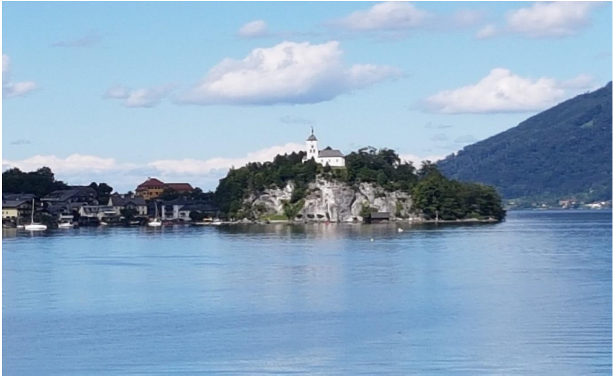
Johannesbergkapelle von Traunkirchen