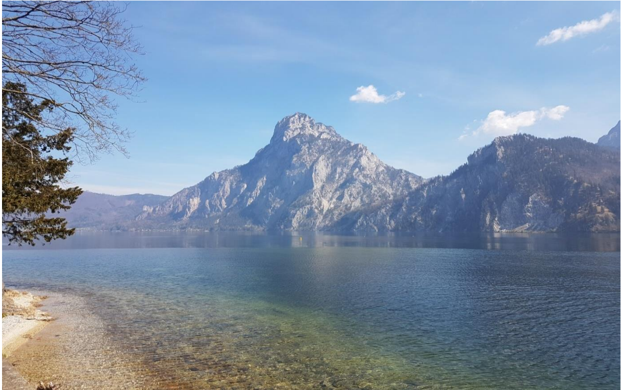
Blick auf den Traunstein von Traunkirchen aus

Vom Klosterplatz fahren wir noch durch eine kleine Parkanlage hinunter zur Schiffsanlegestelle. Links davon kann man auf einer der dort aufgestellten Bänke die Seele baumeln lassen und einen traumhaften Blick auf den majestätischen Traunstein am gegenüber liegendem Seeufer genießen. Auch für eine mitgebrachte Jaus'n ist der Platz ideal.