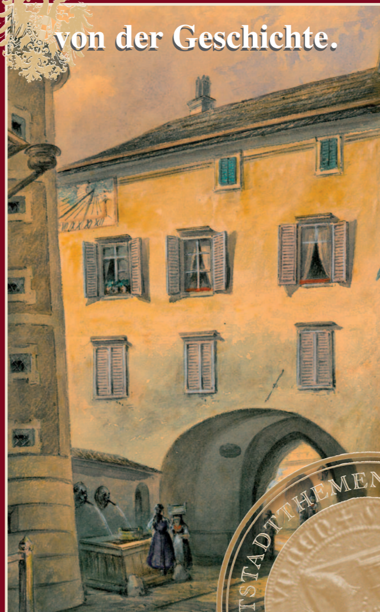
Ein historischer Führer durch die Altstadt der Stadt Gmunden am Traunsee