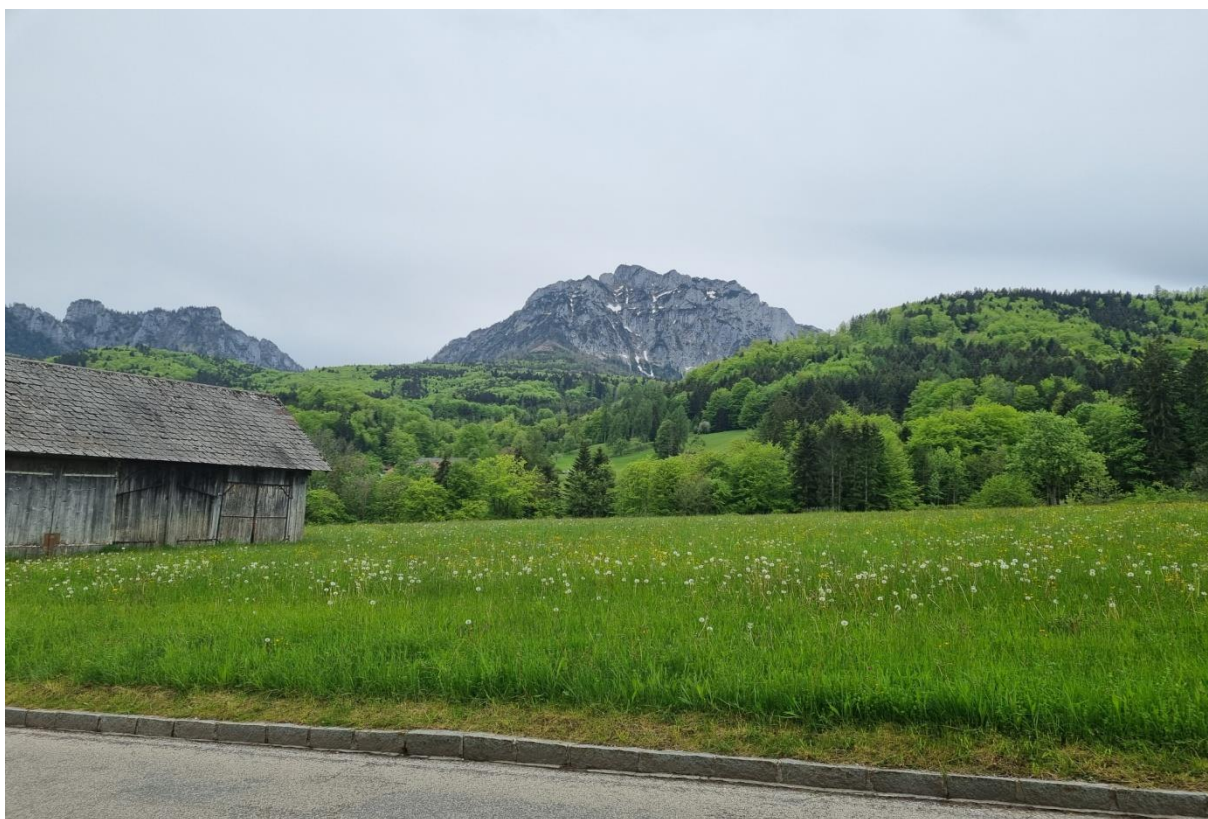
Blick zum Traunstein

Zurück nach Altmünster geht es in umgekehrter Richtung. Wer dort noch etwas die Seele baumeln lassen will, kann dies in der Tapasbar Tapaletta gleich am Solarbad Altmünster tun.