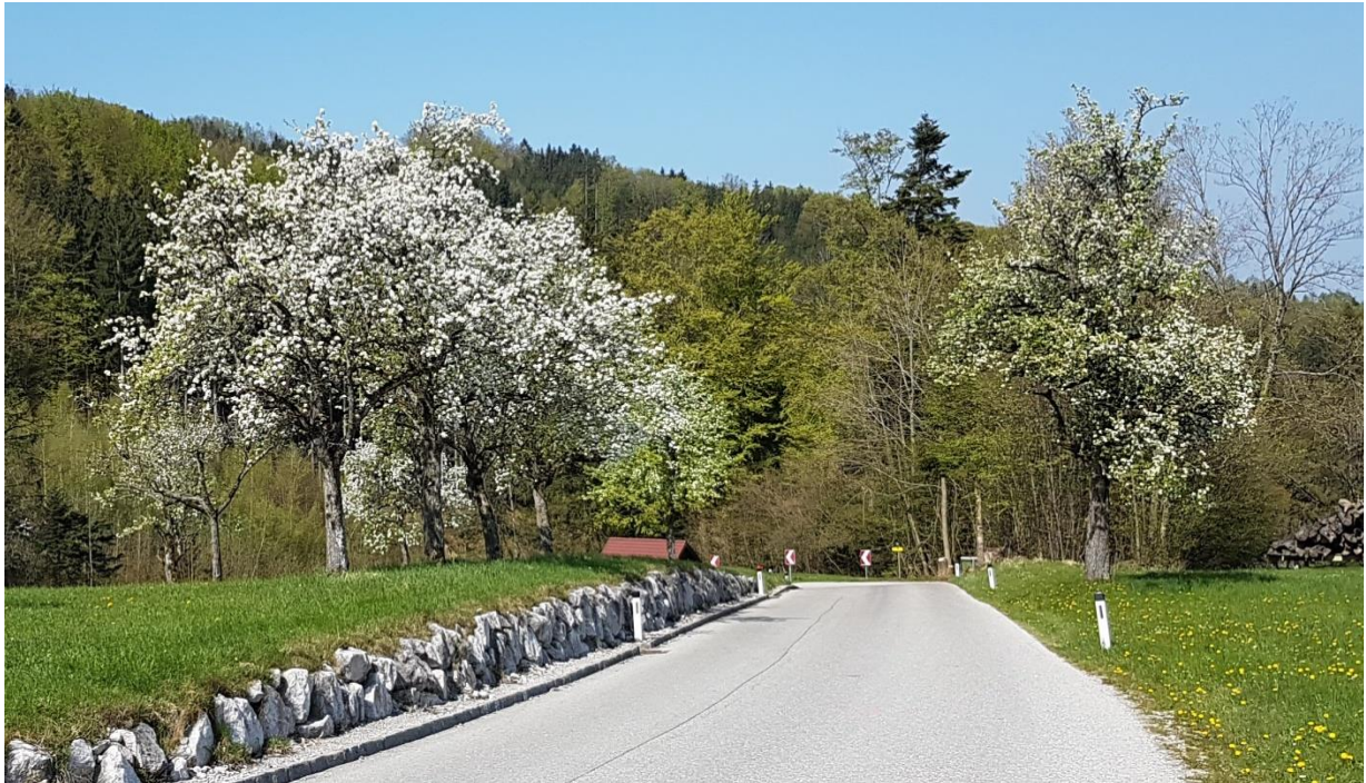
Auffahrt zum Franz'1 im Holz und Silberfuchs