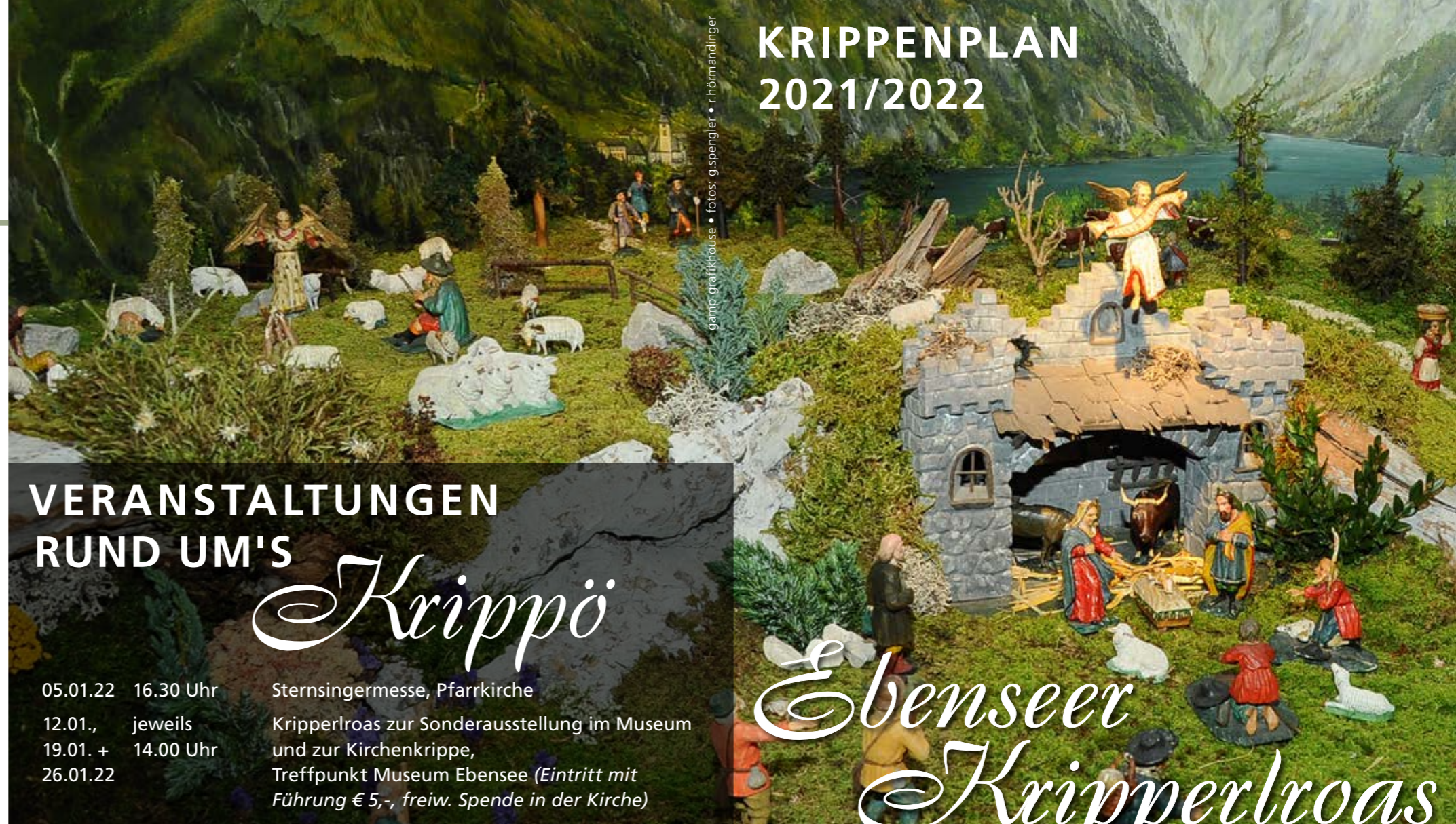
gemma grafikhouse • fotos: g.spengler • r.hörmandinger